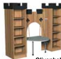
Olivenholz Dekor [4]