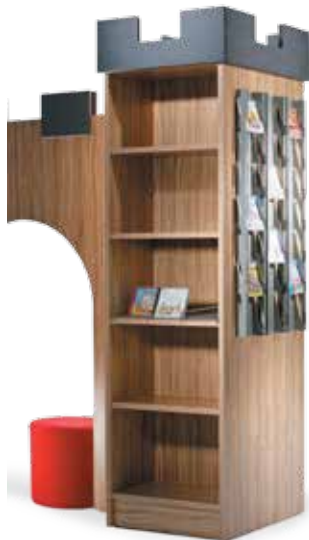
Abb. zeigt 3 CD-Displays

Farbvarianten und Ausführung auf Rollen s. Seite 58