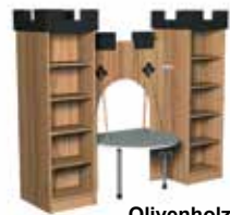
Olivenholz Dekor [4]

Bitte die letzte Stelle der Bestell-No. um die gewünschte Farb-Kennziffer ergänzen.