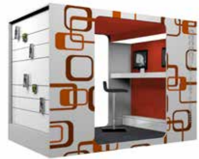
Cocoon Computer-Lounge XL (Grafik nicht standard)