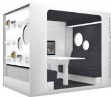
Cocoon Working-Lounge Exclusive

Schaffen Sie eine Zone für Studenten und Arbeitsgruppen mit der Cocoon Working-Lounge.