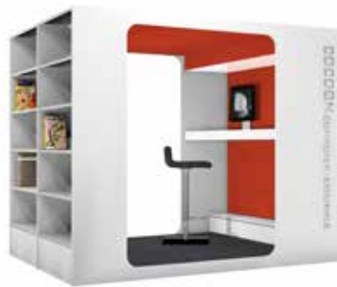
Cocoon Computer-Lounge L

Je nach Wahl des Modells sind die Außenwände zur Präsentation auf einer Hochglanz-Displaywand oder auf Metall-Fachböden nutzbar. Außerdem können Sie in dem Modell mit den zwei Abteilen auch Tröge und viele andere Zubehörteile aus dem Ratio Regalsystem für Unterbringung und Präsentation einsetzen.