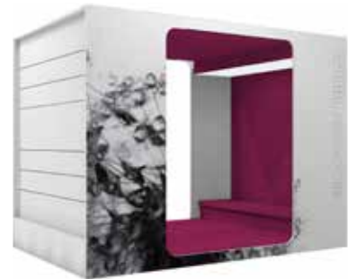
Cocoon Kids-Lounge XL (Grafik nicht standard)