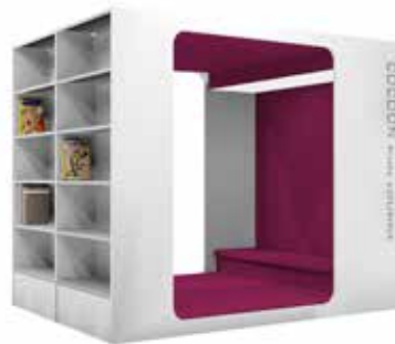
Cocoon Kids-Lounge L

Es gibt zwei Modelle – L und XL - je nachdem ob die Sitzmöglichkeit in der Lounge ein- oder beidseitig gefordert ist. Mit Grafiken an den Seitenwänden der Lounge kann für die richtige Atmosphäre gesorgt werden.